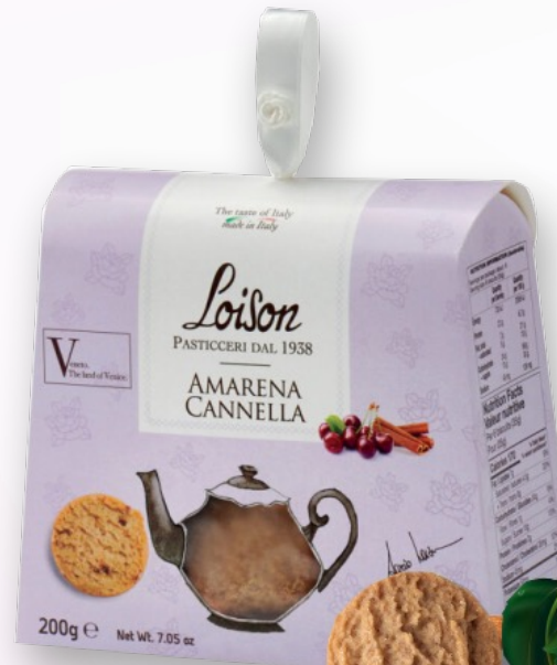
Biscuiti cu Amarena si Scorțișoară, 200g