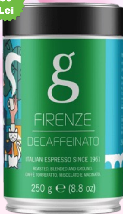
Golden Brasil Firenze Decaf Cafea măcinată decofeinizată 250g