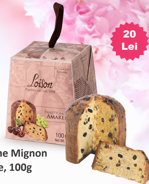
Panettone Mignon Cireșe, 100g