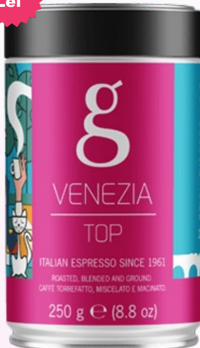
Golden Brasil Venetia Top Cafea măcinată 250g