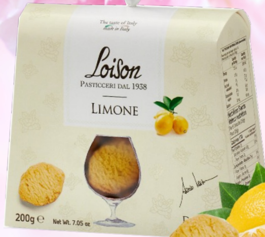
Biscuiti cu Lămâie, 200g