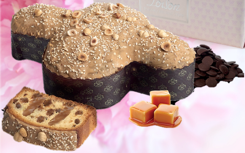
Panettone Colomba Genesi, Caramel Sărat, 600g Cu umplutura și glazură decadentă de caramel sărat și ciocolată