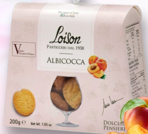
Biscuiti cu Caise, 200g