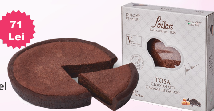
Tosa Ciocolata cu Caramel Sarat, 300g