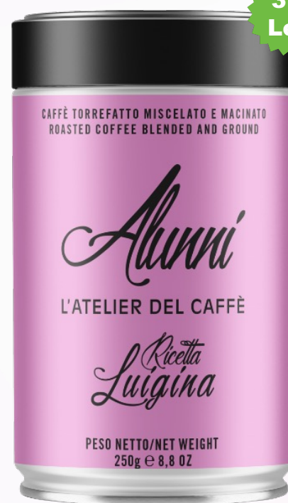
Alunni L'Atelier del Caffee Luigina Cafea măcinată 250g