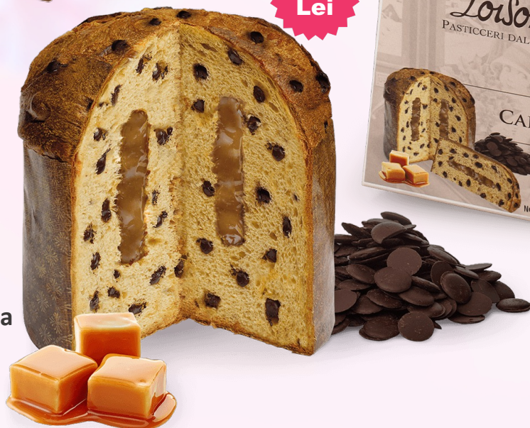
Panettone Astucci cu Crema de Caramel, 600g

Nu exista nicio prăjitură care să îi egaleze gustul. Oricât am povesti despre ea, până nu o încerci nu te vei convinge.